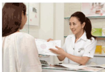
コンサルティング風景

■日 程: 3/31(土)~4/3(火)10:00~20:00(最終日 18:00 終了、4/2 休館日)