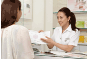
コンサルティング風景